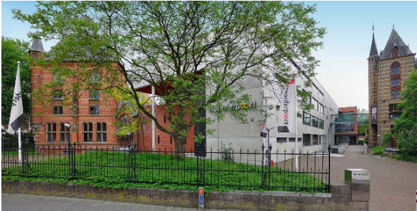
Verlengde Visserstraat 20

Verlengde Visserstraat 20 en Diamantlaan 16